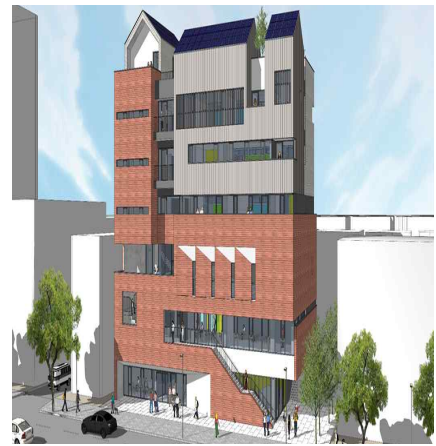
【 조 감 도 】